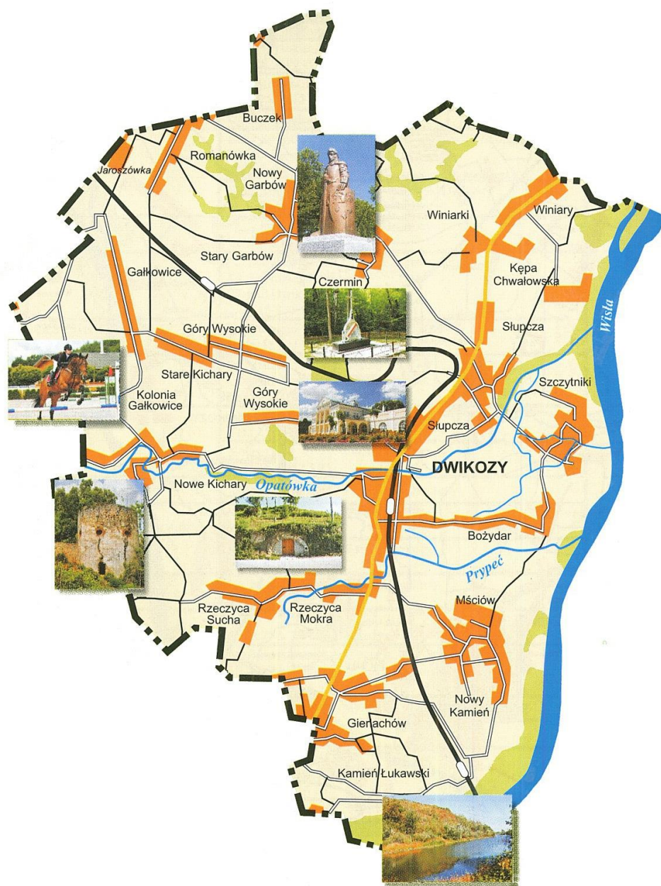
Mapa nr 1. Mapa Gminy Dwikozy